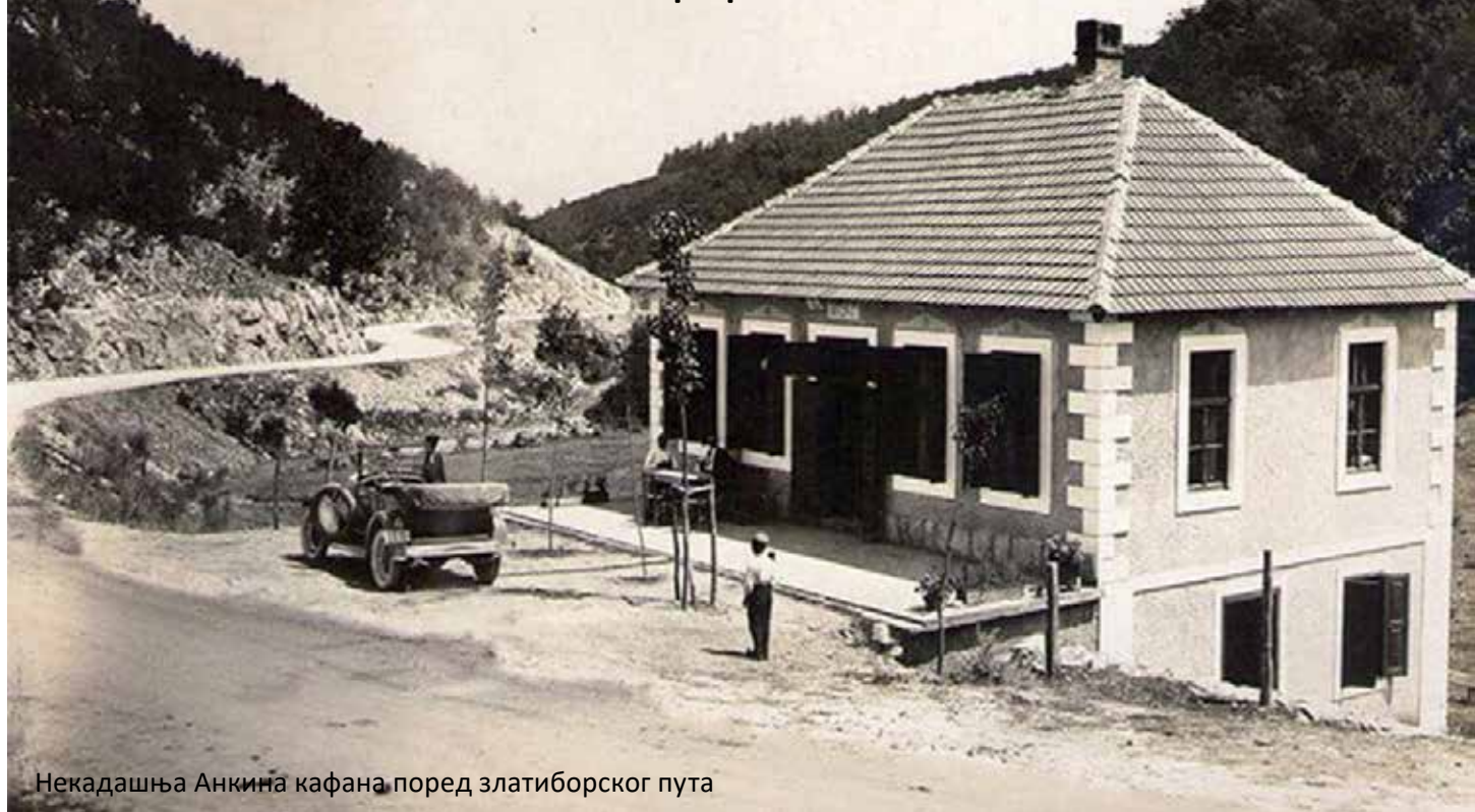
Некадашња Анкина кафана поред златиборског пута

Качамак наш насушни, здраво јело предака, одолева и у ово доба пред налетима кулинарских новотарија и "фаст фуда". У златиборском крају понекад га, зачињеног белим мрсом (зрелим кајмаком и сиром), својим укућанима спремају искусне домаћице, а ево га и у јеловницама појединих ресторана и хотела. С тим што је на овом подручју углавном направљен од белог кукурузног брашна, самлевеног од малих клипова брдског кукуруза.